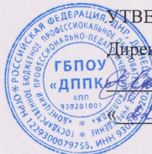
ГРАФИК РАБОТЫ СОВЕТА ПРОФИЛАКТИКИ НА 2023-2024 УЧЕБНЫЙ ГОД