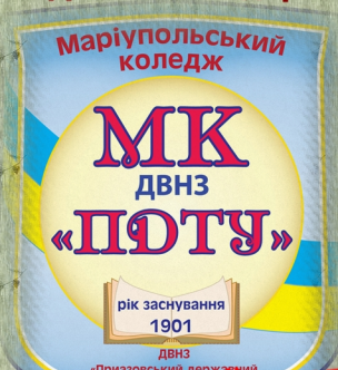
Маріупольський коледж ПДТУ