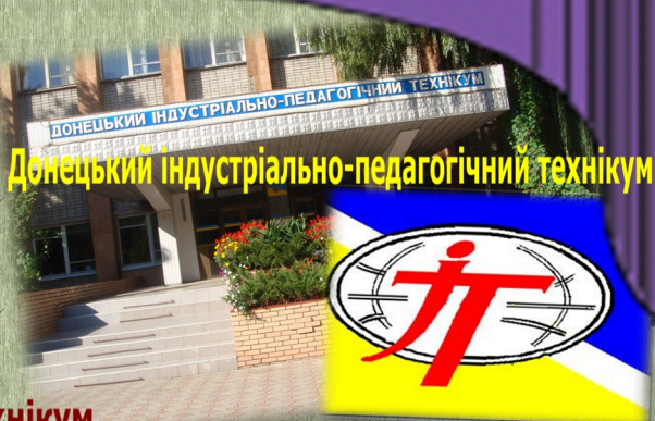
Донецький індустріально-педагогічний технікум