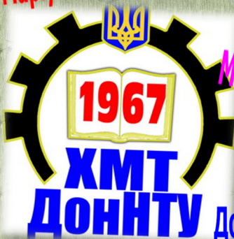
Донецький національний технічний університет